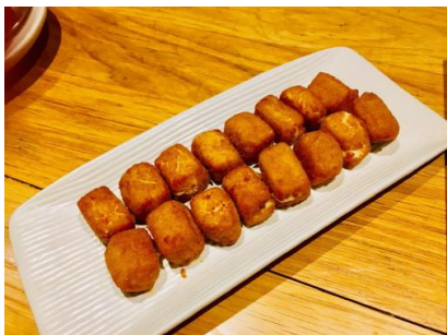
Croquetas / コロッケ…P275