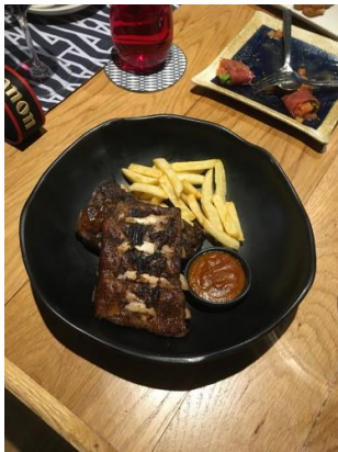
Costillas de Cerdo Iberico/ イベリコ豚のロースト…P1,095