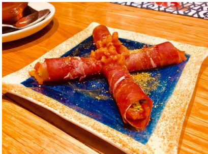
Rollitos de Jamon Rellenos/ 生ハムを巻いたサラダ…P480