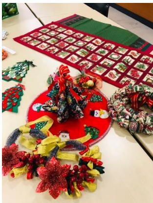
作品:クリスマスグッズ

——ハンディクラフト同好会では時折バザーを開催しているとお聞きしたのですが、作品を購入することもできるのですか？