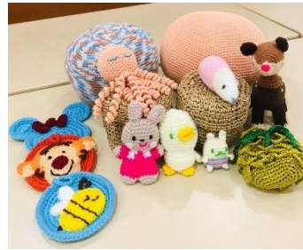
作品:編みぐるみ、小物入れなど