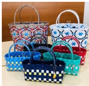
作品：PP バンドカゴバッグ