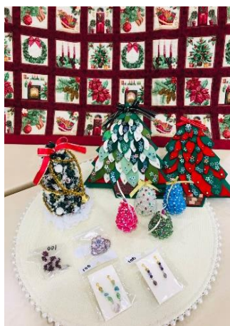
作品:クリスマスグッズ