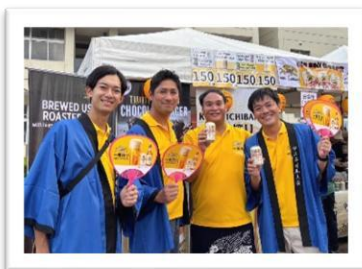
たくさんのブースが全力で みんなをお出迎え！