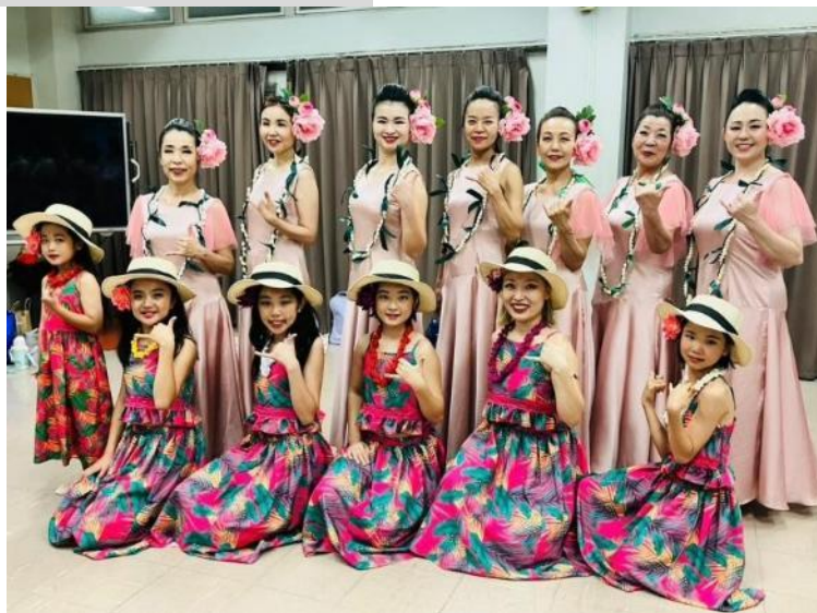
『最後のフラダンス』