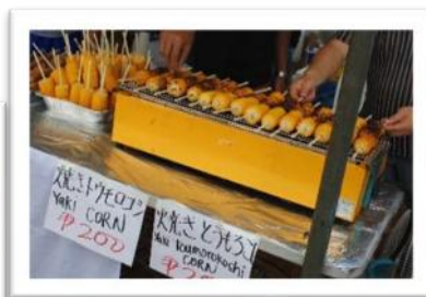
狙いの食べ物は18時前 に行くのが確実！