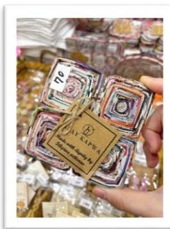
ハンドメイド雑貨 安くてかわいい！