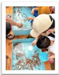
大人気の金魚すくい